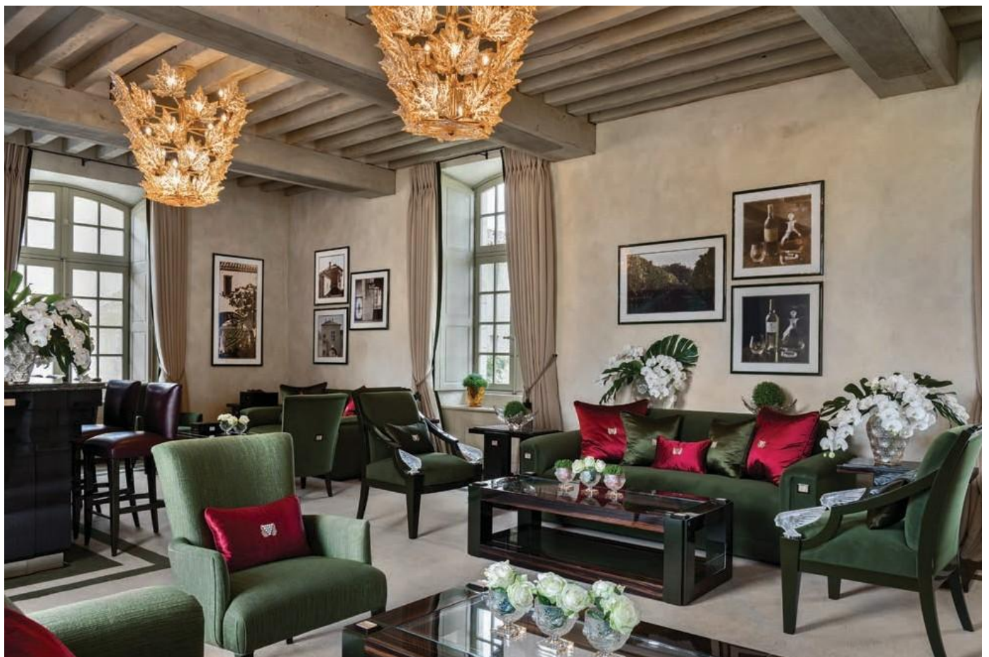
© Agi Simas & Reto Guntli