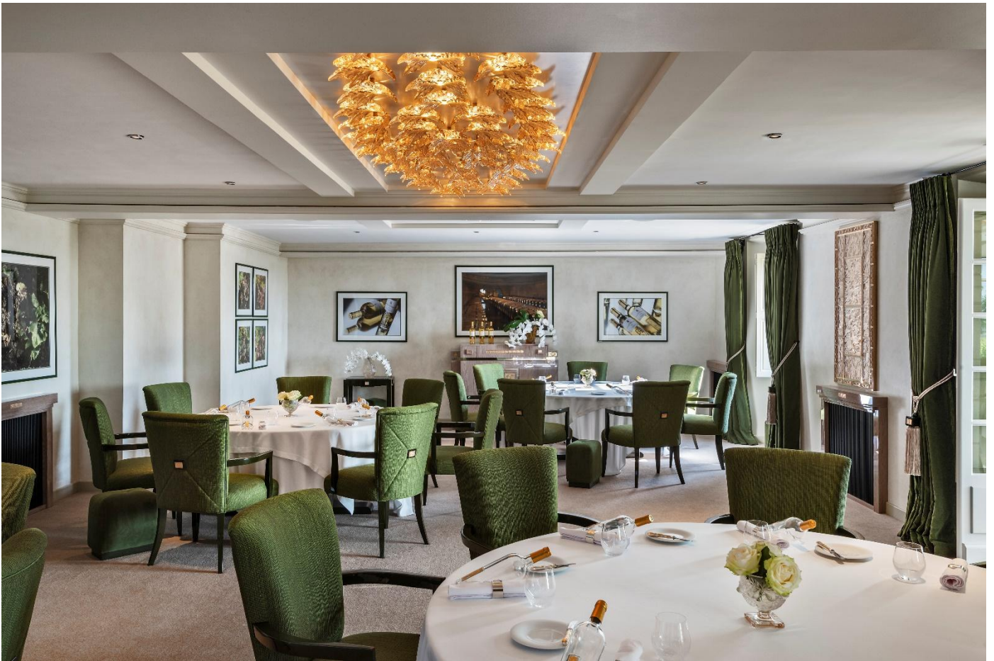
© Agi Simas & Reto Guntli