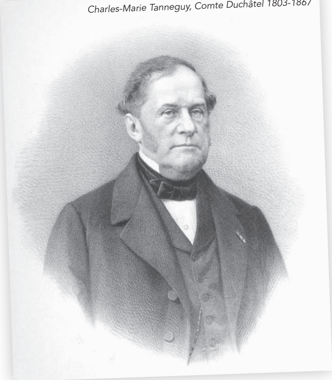
Charles-Marie Tanneguy, Comte Duchâtel 1803-1867

En 1865, Charles-Marie Tanneguy, Comte Duchâtel, ancien Ministre de l'Intérieur (1839-1848), également ancien ministre des Finances (1836-1837) et du Commerce (1834), déjà propriétaire du prestigieux cru médocain Château Lagrange, s'investit pleinement dans la mise en valeur de la propriété en modernisant les installations techniques des chais et en rénovant le Château dans un style hispano-byzantin.