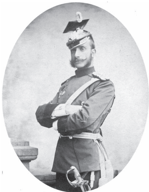
Alphonse XII, 1857-1885, Roi d'Espagne