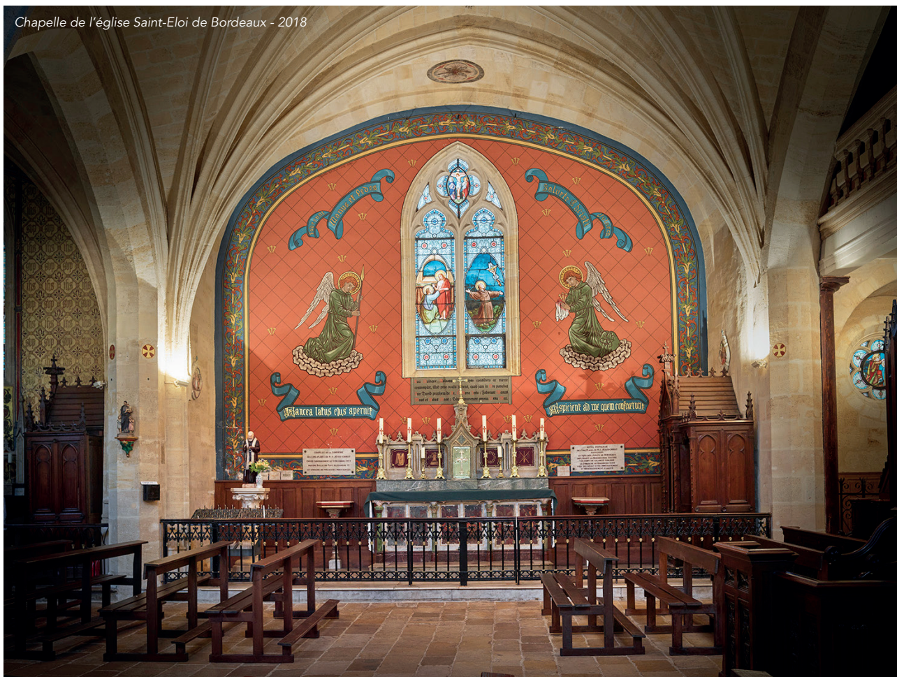
Chapelle de l'église Saint-Eloi de Bordeaux - 2018